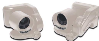
ERH0712 Rx-Tx RAL1013