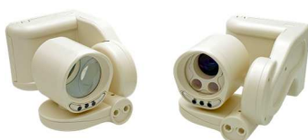
ERRH0712 TRx RAL1013