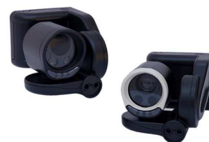
ERH0712 Rx-Tx Pro